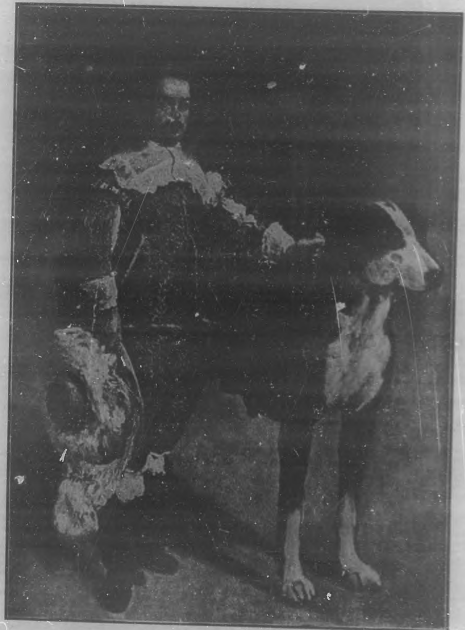
"DON ANTONIO" Cuadro de Velázquez.