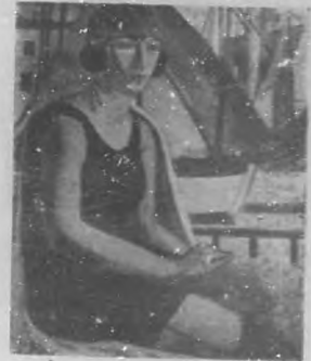
"BAIGNEUSE" Cuadro de Valdo Barbey