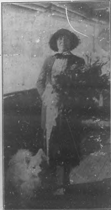
La gloriosa actriz Margarita Xirgu.

Y creo que el teatro español contemporáneo está orientándose hacia un sol de vitalidad y fortaleza, de realismo bien entendido. Entre los nuevos dramaturgos no puedo menos de citar a López Pinillos y a Ardavin, poseedores de fuerza, de intensidad, de valentía. Y a otros muchos. Los hermanos Millares, si mal no recuerdo, han hecho "El Compañerito", obra de enorme vitalidad y de profundo realismo. Sintetizando el argumento, en "El Compañerito" aparece un viejo octogenario que se muere, que se apaga en un asílo, como lámpara a la que faltara el aceite de la vida. En los momentos de extinguirse, surge para acompañar al moribundo una vieja. Cuando las hermanas del Asilo descubren la esposa legítima, la arrojan en exorbitante del lado del lecho del enfermo, porque no era el esposo, era apenas el "compañerito". Y no solamente los jóvenes dramaturgos están haciendo una intensa obra teatral. También los viejos. Guimerá ha estrenado últimamente La alta Banca, obra de gran intensidad, que no ha sido traducida aún al castellano.