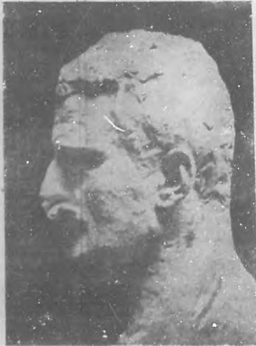
Busto del inmortal escritor Knut Hamsun, obra del escultor noruego G. Vigeland.

Muy pocos son los escritores que han obtenido el Premio Nobel, después de un reconocimiento universal. Casi todos han salido de