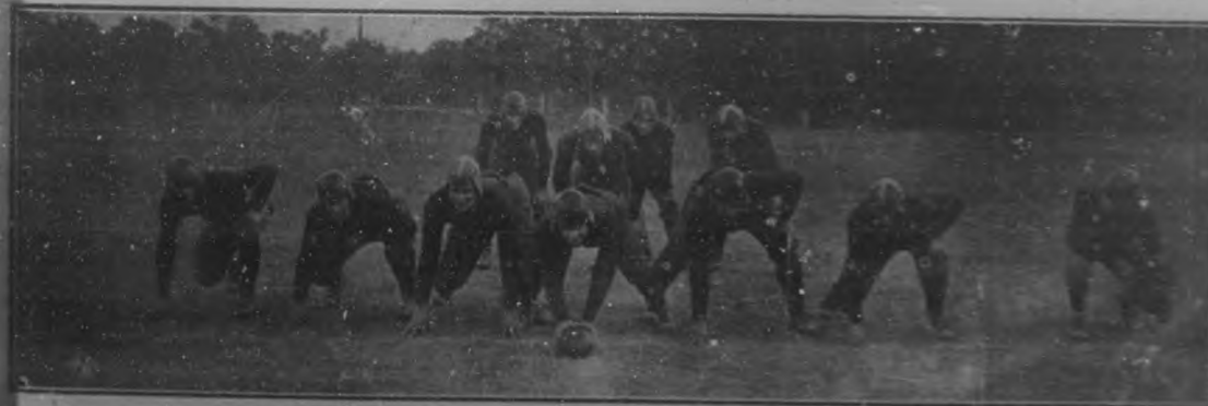
Equipo de foot ball de la Universidad de Mississippi, derrotado por los "tigres" del "C. A. C.", el día último de año, con 27-0.