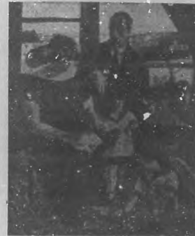
LES SABBACH A LA VILLE Cuadro de G. Sabbach

¿Cómo daros la sensación de esos menguados esfuerzos, de esas funambulescas aspiraciones, de esos rebuscamientos, de esos tuercos y sinrazones inspirados en el prurito de ponerse en evidencia, de toda era masa enorme de insinceridad, en fin, que constituye la exposición frente del Grand Palais? Hay que traer a colación, una vez más, por su exactitud parabólica, la leyenda de la bíblica Babilu.